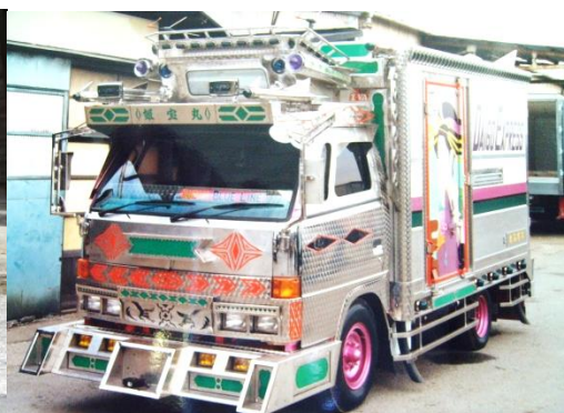
イメージ画像（「2トントラック デコトラ」で検索） *実際には装飾を含めた検証が必要です。

松井産業は今後とも、報道・メディア関係各位にユニークなニュースソースをご提供できるよう、努力してまいります。