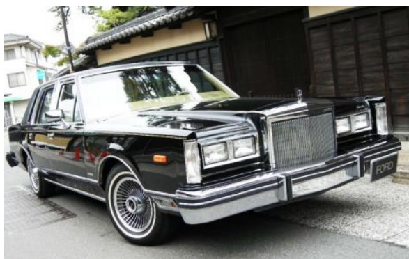
イメージ画像（「リンカーンタウンカー」で検索）

「びっくり間取り」「面白い賃貸住宅」を取材されている方は、ご入居希望者が契約される前に限っての取材チャンスとなります。ご連絡をお待ちしております。